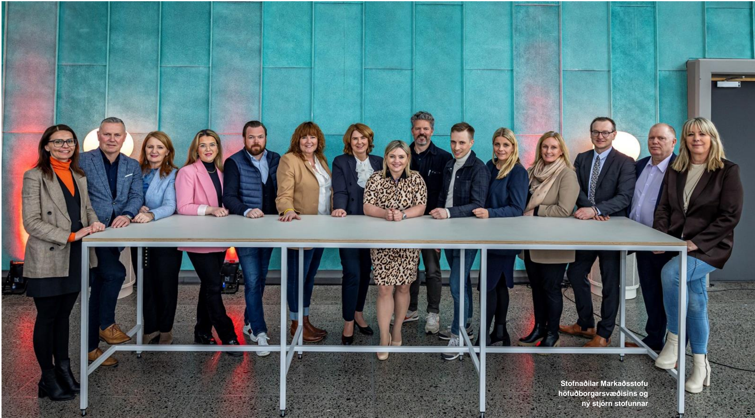
Stofnaðilar Markaðsstofu höfuðborgarsvæðisins og ný stjórn stofunnar